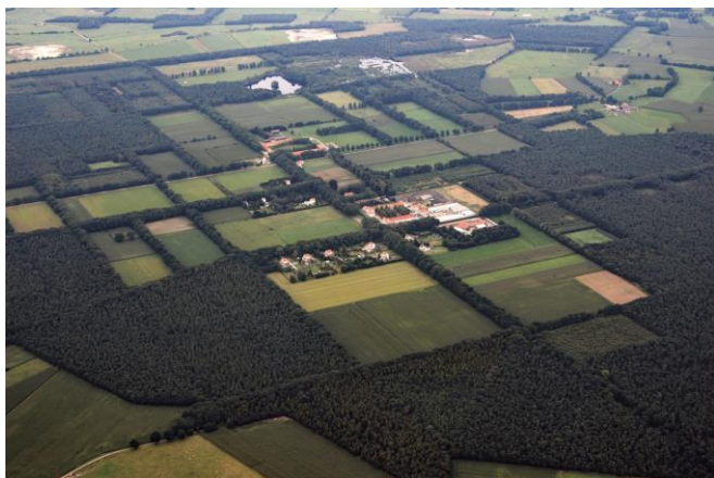
Wortel Ludo Verhoeven

In de lezing zal enerzijds worden ingegaan op die ontwikkeling van het landschap, en anderzijds op wat het betekent voor een gebied om 'op te gaan' als UNESCO werelderfgoed.