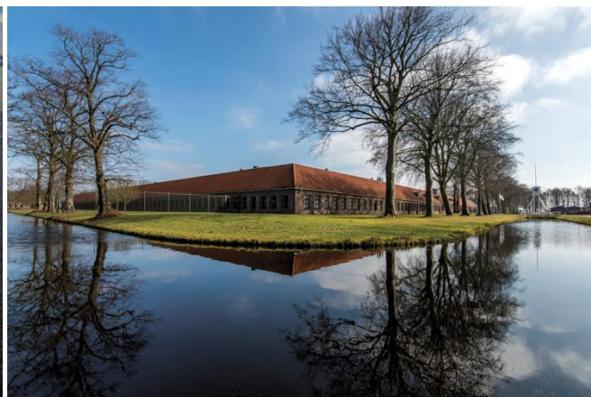
Tweede gesticht R. James van Ieuven