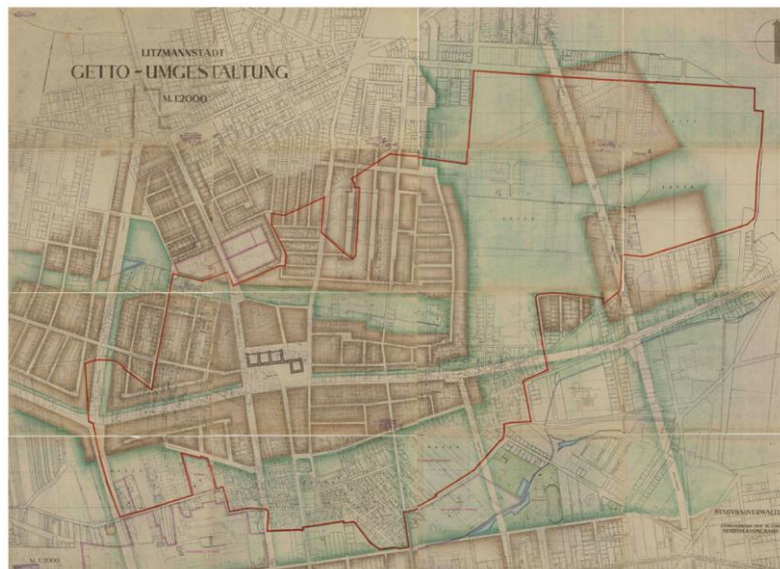
Afbeelding 1: Verspreiding van Duitsers, Polen en Joden in Lodz, begin 1940.